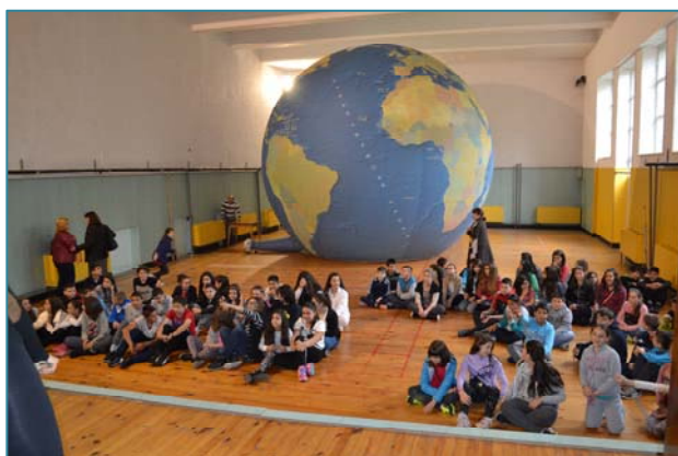
«Земно кълбо» в Хасково