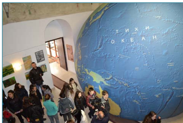
«Земно кълбо» във Враца