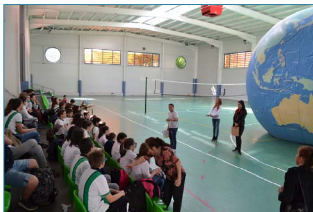
«Земно кълбо» в Пловдив