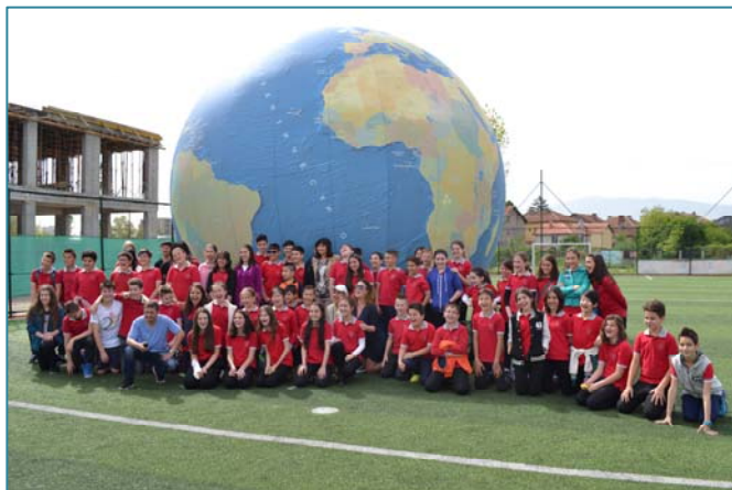
«Земно кълбо» в София